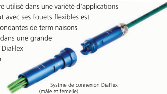
Système de connexion DiaFlex (mâle et femelle)

Le connecteur DiaFlex est polyvalent et peut être utilisé dans une variété d'applications grâce à ses caractéristiques. La version Fan-Out avec ses fouets flexibles est typiquement intégrée dans les versions correspondantes de terminaisons de câble 19" (Patchpanel) et peut être utilisée dans une grande variété d'applications différentes. Les Fan-Out DiaFlex sont utilisés dans toutes les applications où un connecteur flexible est requis ou si les interfaces ne sont pas encore connues au début de l'installation.