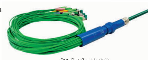
Fan-Out flexible IP68

Un oeillet de tirage peut remplacer le Fan-out temporairement, afin de permettre l'insertion du DiaFlex dans un tuyau ou une canalisation existante. Le Fan-out muni des fouets peut ensuite être installé sur le DiaFlex.