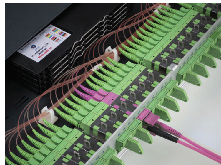
Flexpatch 1U OM4