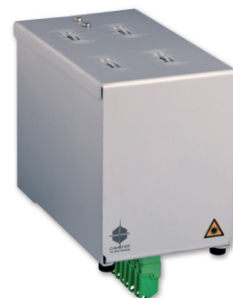
flexModul Box - Vue face avant